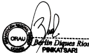
Berlín Diques Rios Presidente de ORAU